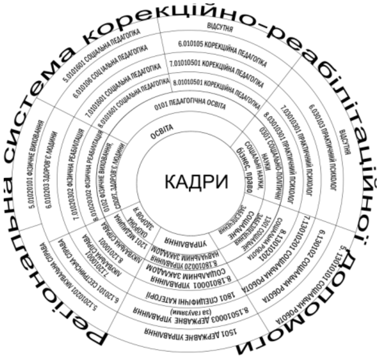
Рис 1. Модель підготовки кадрів для регіональної системи корекційно-реабілітаційної допомоги

Умовні позначення: 1 – назва галузі знань, 2 – шифр та найменування галузі знань; 3 – код та найменування спеціальності магістра; 4 – код та найменування спеціальності спеціаліста; 5 – код та найменування спеціальності бакалавра; 6 – код та найменування спеціальності молодшого спеціаліста