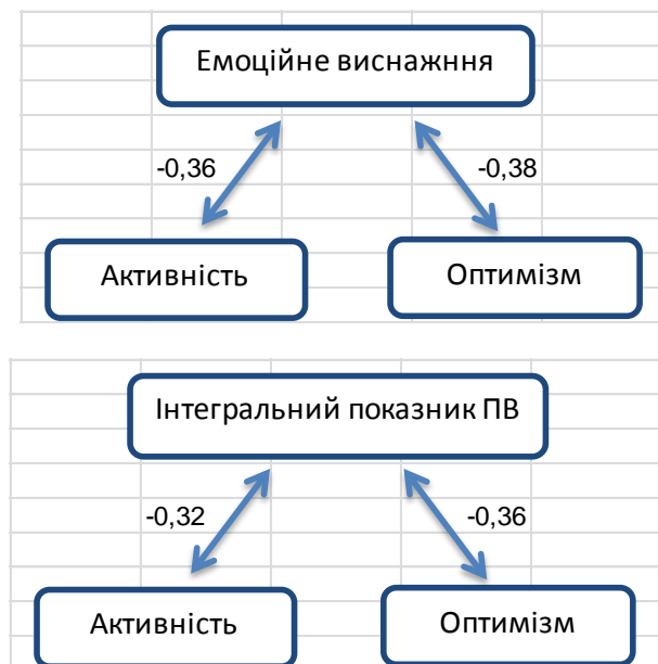
Рис. 4. Значимі кореляційні зв'язки показників професійного вигорання та оптимізму й активності

Наочно значимі коефіцієнти кореляції показників професійного вигорання з оптимізмом і активністю представлені на рис.4.