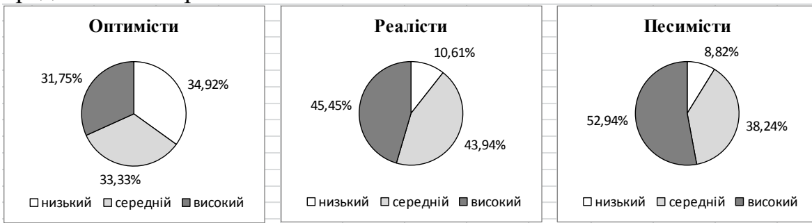
Рис. 2. Рівні емоційного виснаження педагогічних працівників ЗНЗ для розумово відсталих учнів з різним психологічним типом особистості

особистості (оптимістів, реалістів та песимістів). Наочно результати представлені на рис. 2.