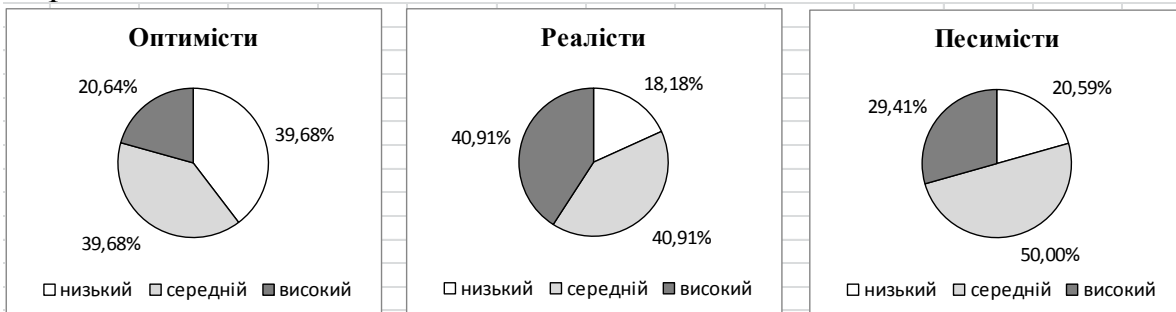
Рис. 3. Рівні деперсоналізації педагогічних працівників ЗНЗ для розумово відсталих учнів з різним психологічним типом особистості

Достовірні відмінності між педагогічними працівниками з різним типом особистості (оптимістами, реалістами та песимістами) отримані також за показником деперсоналізація. Наочно результати представлені на рис. 3.